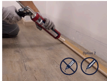
avec colle (sans colle silicone)