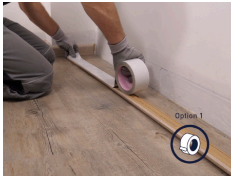
avec ruban adhésif